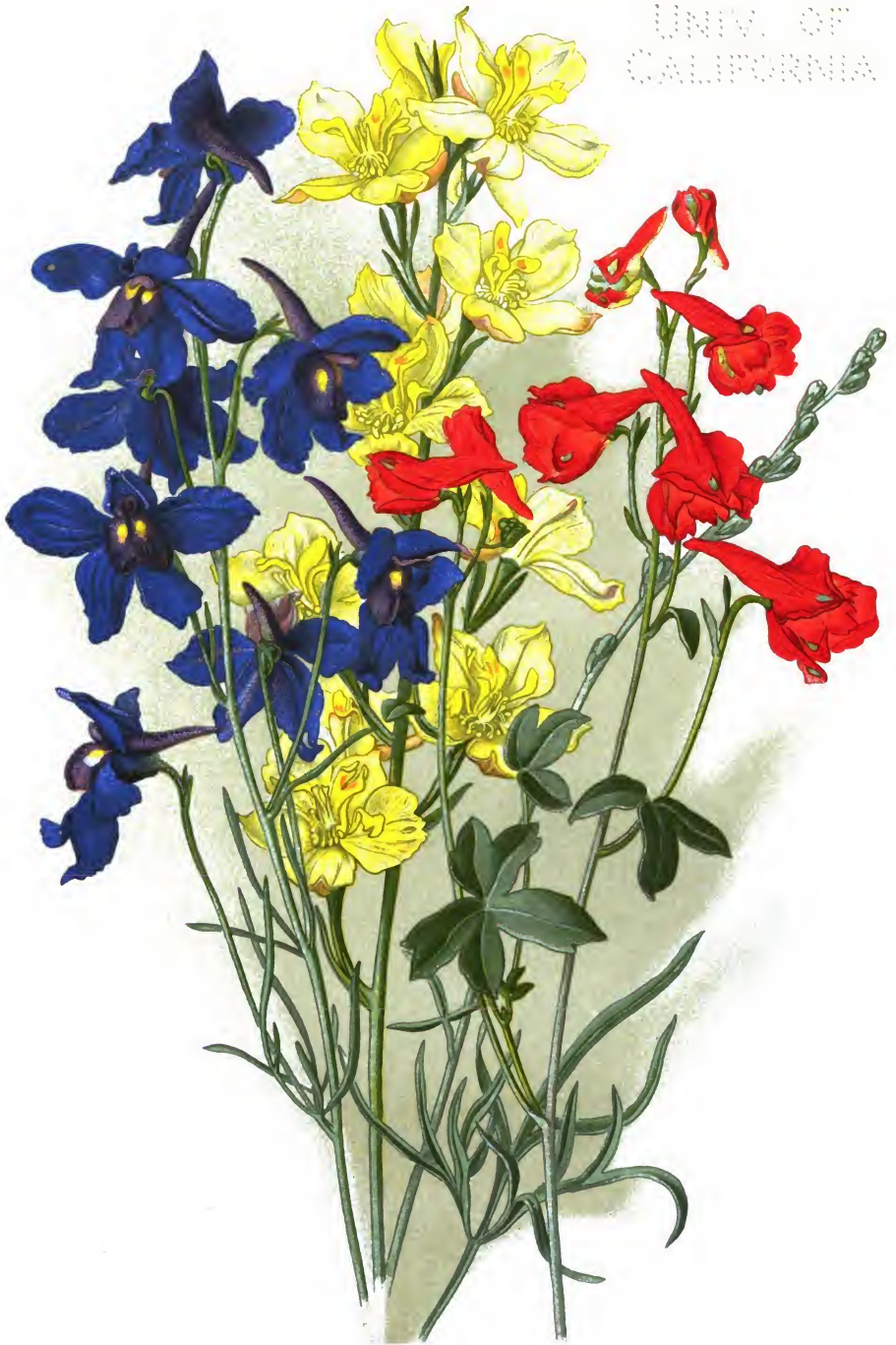
Delphinium grandiflorum L., — D. Zalil Aitch. (D. sulphureum Hort.), — и D. nudicaule Torr. et Gr.